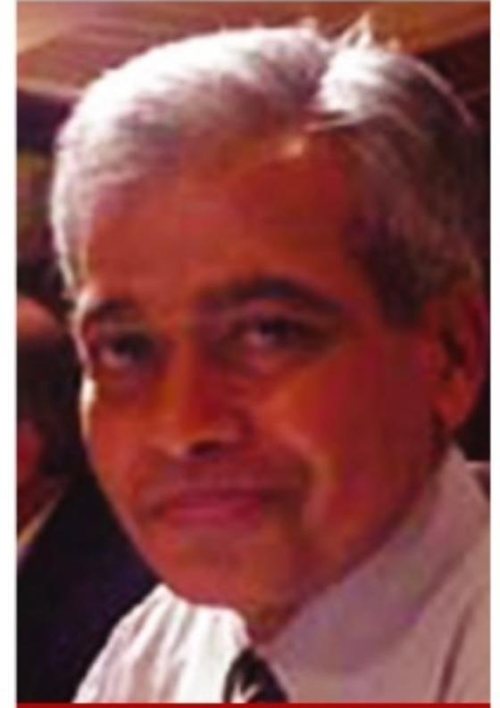
கிராஜ் விஜேசிங்க தலைவர் பார்த்தீக் குழு

கே: சித்தகுணத்திலும் செலான் வங்கியுடன் தொடர்பு கிருக்க ஏன் தீர்மானித்தீர்கள்?