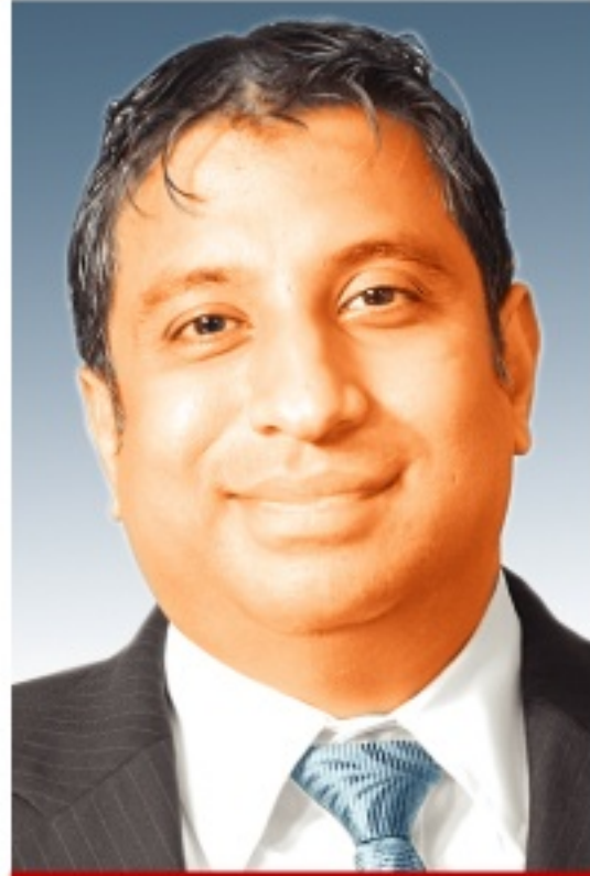
ஜெயர் நாயகங்கார் உப தலைவர் எல்.ஓ.எல்.சி. குழு